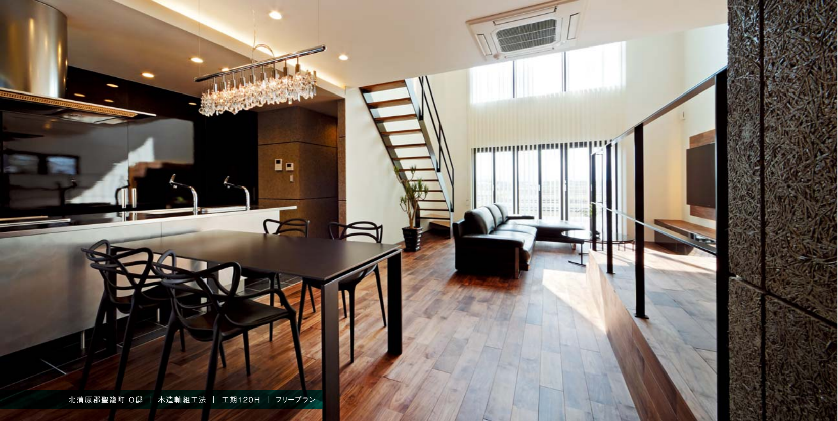
北蒲原郡聖籠町 O邸 | 木造軸組工法 | 工期120日 | フリープラン