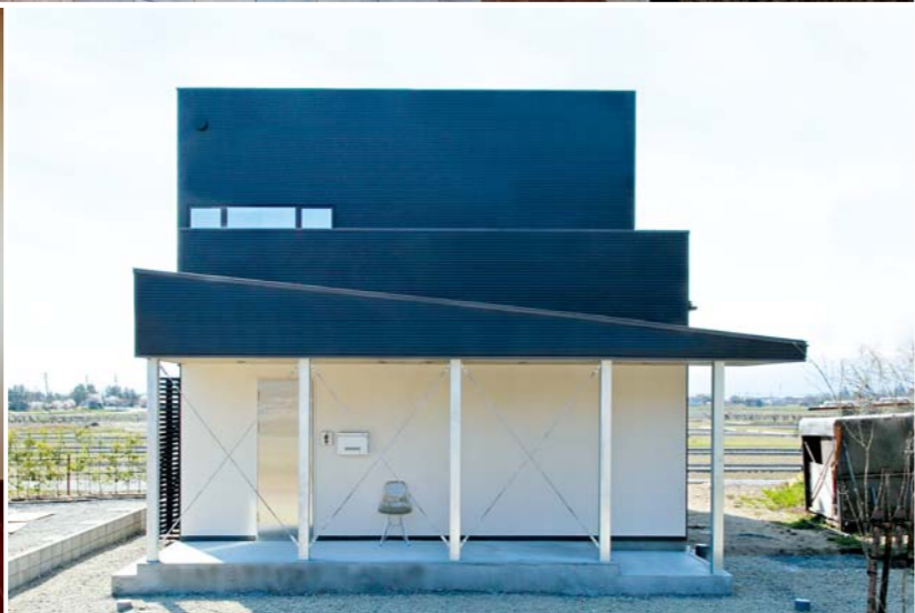
右頁 / 正面に中庭が見える見通しのいい設計。アイアンで製作した細い手すりは、2階の白い箱の浮遊感をいっそう強めている 上 / 右手には、一段高いところに書斎コーナー、左手にはキッチンのある広いLDK 下左 / 玄関とLDKの間に設けられた中庭 下中 / 2階の洋室からは、吹き抜け空間を介して外の景色が見える 下右 / 玄関に至るまでに、回廊を設けた外観。回廊に椅子を置けば、くつろぎの空間にもなる

無垢の木や鉄、タイル、石などを「素材合わせの妙」ともいえる技と感性で組み合わせ、独自のスタイルを提案しているネイティブプレイス。このO邸でも、素材の持つ質感をいかにしながら、スタイリッシュな世界をつくり出している。 「眺めのいいところで暮らしたい」と高台に土地を求めたO夫妻。設計は当然、眺望をいかすこと、外への抜けの良さを第一に考えられた。たとえば玄関を開けたとたん、視線はまっすぐ、中庭やリビングを貫通して窓の外へと突き抜ける。この見通しの良さは圧巻だ。さらにリビングの大きな掃き出し窓から、そして2階では吹き抜けの上部に設けられた窓からも外が見える。特に2階の洋室から見る眺めは、浮遊感も手伝って特別な感じを抱かせる。 一方、この開放感を損なわないために、細かな計算もなされている。アイアンで造作した階段などの手すりは限界まで細くしたり、TVボードなどの家具は造作にして空間に融け込ませたり。骨太なテイストながらもスタイリッシュなのは、こうした二つひとつのディテールが繊細に扱われているからだろう。 「Oさんとは、目指す方向がまったく同じだったので、提案のしがいがあり、スムーズに進みました」とは設計を担当した戸松藤人さん。まずは感覚の合うビルダーと出会うこと。それが、幸せな家づくりを導く大切な一歩だと教えてくれる家だ。